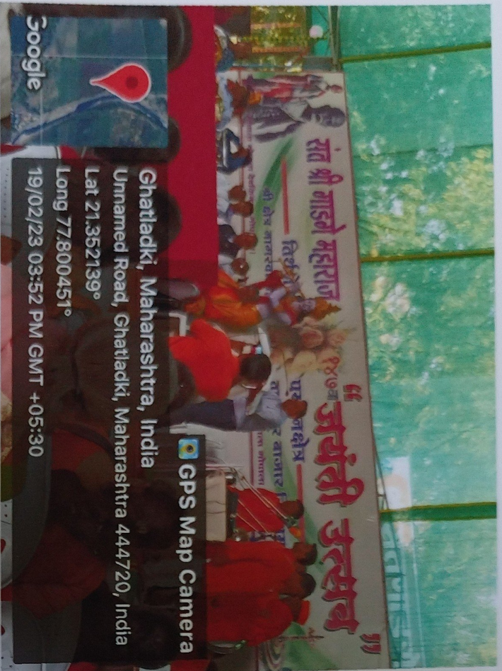
Distribution of Utensils to tribal students at Sant Gadgebaba Ashram School at Nagarwadi, Dist. Amravati M.S. 19 th Feb 2023