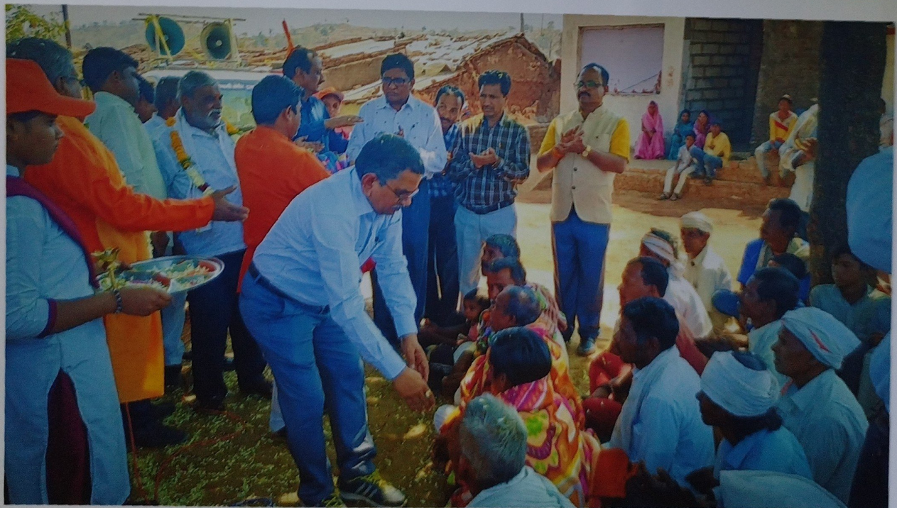
Distribution of Saries and Blankates to Tribal Peoples at Salona Village of Melghat Forest, Dist. Amravati M.S.