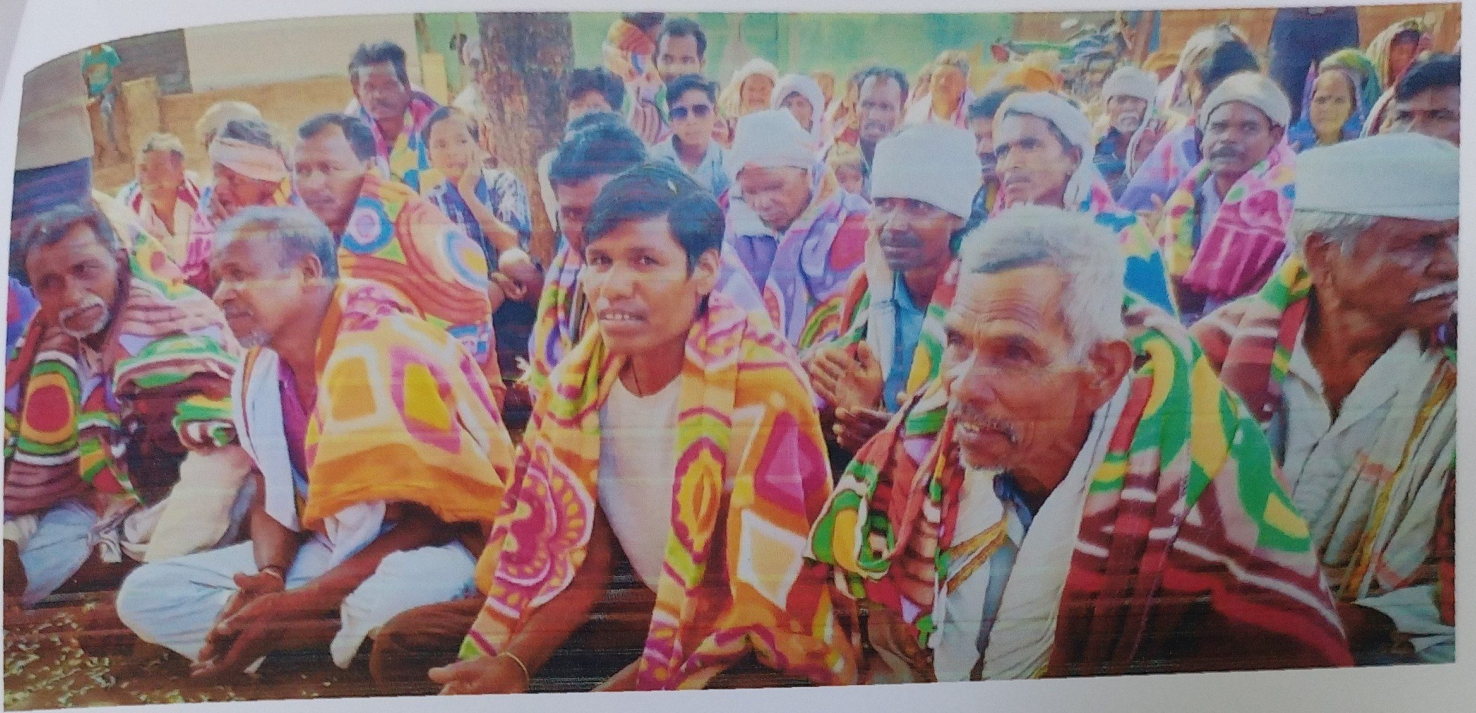
Distribution of Saries and Blankates to Tribal Peoples at Salona Village of Melghat Forest, Dist. Amravati M.S.