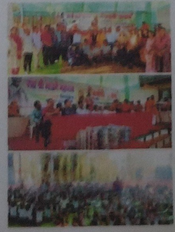
शिवाजी विज्ञान महाविद्यालय नागपुर यांच्या मदतीने श्रीक्षेत्र नागरवाडी येथील आश्रमशाळेतील विद्यार्थ्यांना सुंदर भेट वस्तूंचे वितरण